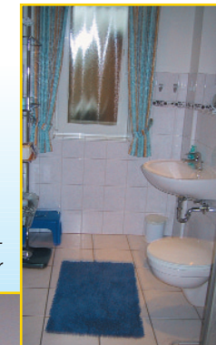
Schlaf- und Badezimmer