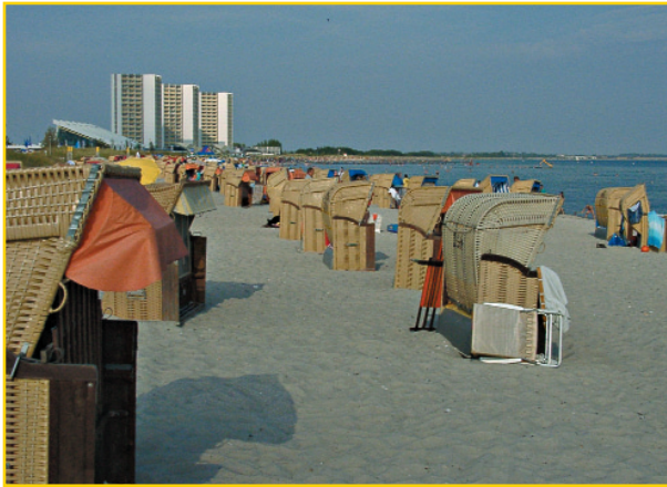
Der Badestrand von Burgtiefe